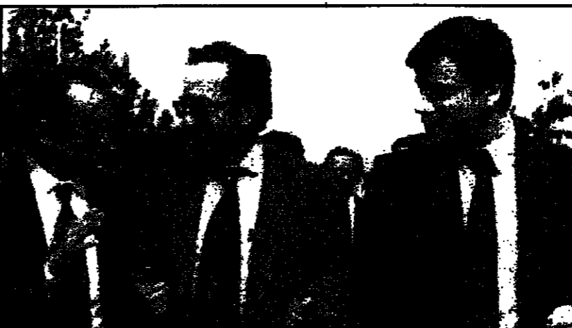
اسماعيل كاداريه (وسط) لدى عودته الى لبنان بعد سقوط البعثية في 1992

منذ عام 1995، تعرفت على الكاتب اللبناني الشهير، والمقيم في باريس، اسماعيل كاداريه في إحدى المكتبات الباريسية التي افتتحها له حفلة توقيع بمناسبة صدور كتابه «أشيل أو الضائع الكبير» وكتاب حوارات مع اسماعيل كاداريه أجراها الشاعر الراحل بوسكيه. ومنذ ذلك الحين وأنا أخطى لأجزاء هذا الحوار معه، وقد تعيدت لقاءاتنا مرات عديدة وفي مناسبات مختلفة. وبعد أن شهدت أصول التعارف بيننا، وكأنت الصلة تتطعم بيننا ولا تقاى الأخير في مجالس المكتبات الباريسية، بسبب تعبير وتم هاته إذ بدأ لي أعطني رقم هاتفه الجديد. وفي الأيام الأخيرة، كان الكاتب اللبناني مشغولاً لتبليغ اسمه ضمن جائزة نوبل، وأخيراً استجاب لتبليغي وحده لي موعداً في مقهى روستاند، الوجهة الحقيقية للكوميديين في الساعة السادسة والنصف من مساء يوم الخميس للمصادف 23 تشرين الأول (أكتوبر). ومن عادتني أنتي انشغل مع الكاتب الذي أقر أجزاء الحوار معه، سواء في الأطلال التي كتبه أو في المقالات والحوارات التي كتبت عنه. للتعرف عن اسماعيل كاداريه، لا بد من العودة إلى الجذور السياسية في 25 تشرين الأول (أكتوبر) من عام 1990. لقد رشح اسم الروائي اللبناني اسماعيل كاداريه مرات عديدة لجائزة نوبل، وقد كان عضواً في اتحاد الكتاب اللبنانيين، من عام 1970 حتى عام 1982، وقد انتخب في تيرانا كاتب في المجلس الشعبي.